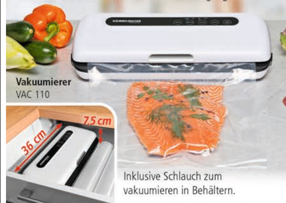
Vakuuier VAC 110

Kompakt und leistungsstark! Dieser handliche und attraktive Vakuuier saugt bis zu 97 % der Luft aus den speziellen Vakuuierbeutel und versiegelt diese dann vollautomatisch mit einer stabilen Naht in nur einem Arbeitsgang.