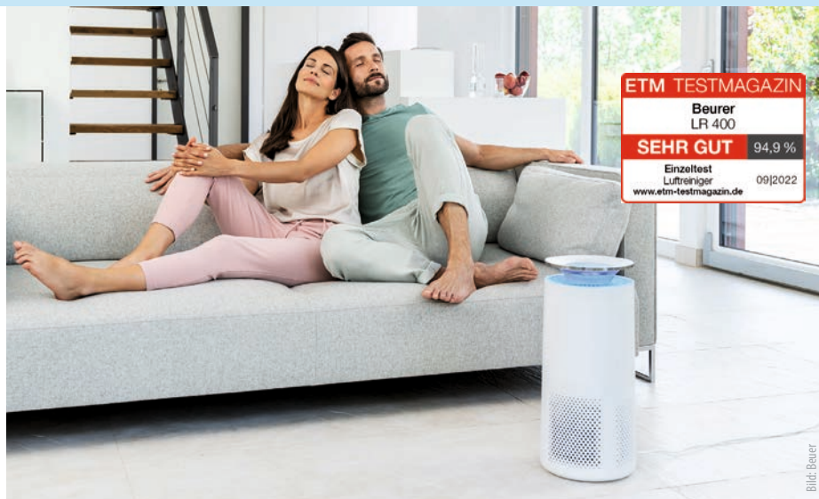
Beurer Luftreiniger LR 400

Wie die drei weiteren Modelle des Luftreiniger-Newcomers Xiaomi wurde auch dieser vom TÜV Rheinland zertifiziert. Die innovative Series ist nach TÜV Rheinland 2 PFG 2753/02.21-Standard in Bezug auf die Filtereffizienz, die Reinigungsrate von Allergenen in Innenräumen und die Bewertung der Innenraumumgebung getestet und bestätigt worden.