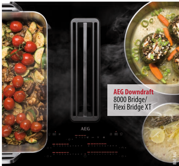
AEG Downdraft 8000 Bridge/ Flexi Bridge XT

Die vertrauensvolle Partnerschaft zu unseren Handelspartnern steht für uns weiterhin klar im Fokus. Ganz im Sinne »Premiummarke, Premiumauftritt« setzen wir am Point of Sale auf starke Bildwelten sowie Kernbotschaften aus unserer Markenkampagne »Für alle die mehr erwarten«. Zusätzlich bieten wir unseren Handelspartner*innen mit unseren digitalen Toolkits ein schlagkräftiges Paket an digitalen Inhalten von Online-Bannern über Anzeigenvorlagen und Micro-Webseiten bis hin zu aktivierenden Social-Media-Formaten. Ab 2023 bieten wir zusätzlich jedem Händler und jeder Händlerin die Möglichkeit, AEG-Inhalte auf ihrer Website im Look and Feel unserer Marke zu präsentieren. Vor allem setzen wir weiterhin auf den persönlichen Kontakt und unterstützen unsere Handelspartner*innen mit digitalen oder Vor-Ort-Trainings. Ein Highlight sind unsere Workshops im AEG Taste Lab, das einen exklusiven Blick hinter die Kulissen unseres Werks im mittelfränkischen Rothenburg ermöglicht.