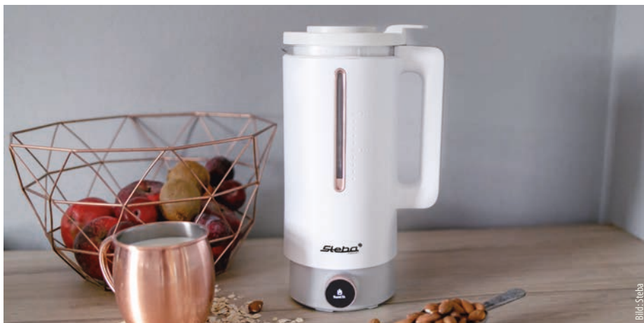
Steba VDM 2 Hot & Cold

Im Handel ist die Kaffeemühle EKM 400 zu einer unverbindlichen Preisempfehlung von 129,99 Euro erhältlich.