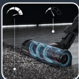
AUTOMATISCHE ANPASSUNG AN DIE BODENART