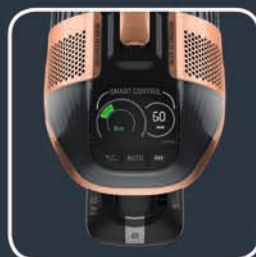
DIGITALES DISPLAY MIT 5 SAUGMODI