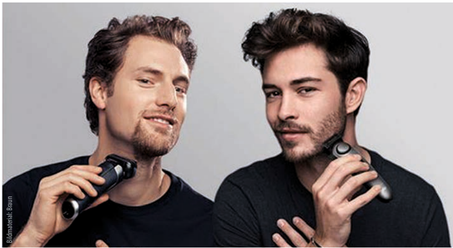
Shaving- und Styling-Studie von Braun