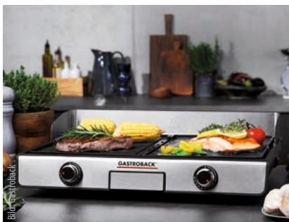
Design Tischgrill Plancha & BBQ

Design Tischgrill Plancha & BBQ besteht aus zwei professionellen Grill-Wendepplatten aus massivem Alu-Druckguss mit zwei Temperaturkreisen, die in sechs Stufen getrennt voneinander regelbar sind. Diese sind mit einer glatten Plancha-Seite und einer geriffelten BBQ-Seite ausgestattet. So lassen sich auf der extra großen Grillfläche für einen echten »Surf'n'Turf-Burger« zum Beispiel die Meersfrüchte auf der Plancha-Seite zubereiten, während die Fleischpatties auf der geriffelten Seite ein appetitliches Grillmuster erhalten.