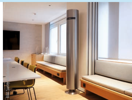
UV-C-Technik Luftentkeimung mit Licht