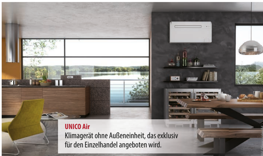
UNICO Air Klimagerät ohne Außeneinheit, das exklusiv für den Einzelhandel angeboten wird.