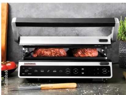
Design BBQ Advanced Smart

Design BBQ Pro liefert den kulinarischen Einstieg ins Kontaktgrillen, während das Highlight im Barbecue-Sortiment von Gastroback der Design BBQ Advanced Smart mit Fleischdickenmessung ist. Denn die richtige Kombination aus Grilltemperatur und Grillzeit ist ein entscheidender Faktor für die optimale Zubereitung des Grillguts. Es gibt verschiedene Möglichkeiten die richtige Grillzeit und Temperatur zu ermitteln. Wer allerdings beim Grillen nicht durch eine Garzeit-Tabelle für jede Fleischsorte und Fleischdicke blättern möchte, ist mit einer smarten Funktion der Fleischdickenerkennung im Zusammenspiel mit voreingestellten Grillprogrammen am Besten beraten.