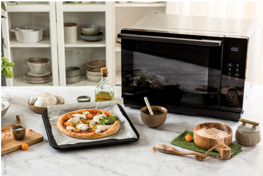
4-in-1 Dampfbackofen NN-DS59NM