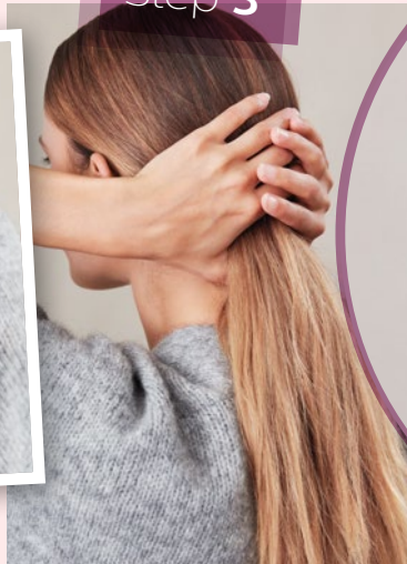
Die glatten Haare zu einem Pferdeschwanz unten am Hinterkopf binden.